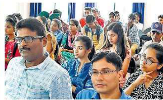
पर्यावरण पर आयोजित कार्यशाला में उपस्थित छात्र।