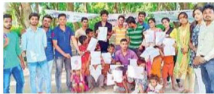
बच्चों के बनाए गए चित्रों को दिखाते एलएनडी कॉलेज के एलएनएस स्वयंसेवक

गरीब की सफाई घर की जोर दिया गया, हाथों को कैसे साफ रखें, इसे भी समझाया गया