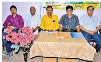
एल एन डी कॉलेज में आयोजित कार्यशाला में उपस्थित अतिथिगण।