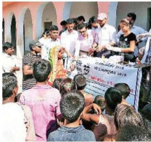
जागरूक करते एलएनएस कॉलेज के एलएनएस स्वयंसेवक • जवाहर