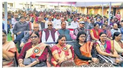
महिला कॉलेज में आयोजित हीरक जयंती समारोह में उपस्थित लोग।

कुलपति ने की घोषणा • नए सत्र से कॉलेज का शुरू हो जाएगा छात्रावास, नए कोर्स भी होंगे शुरू