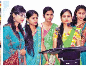
कार्यक्रम के पूरे खाना मान की प्रकृति दिवस उत्सव • जगज्ज