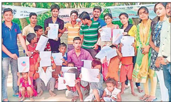
गोद लिये गांवों में चित्रकला प्रतियोगिता में बच्चों के साथ वोलेंटियर्स।