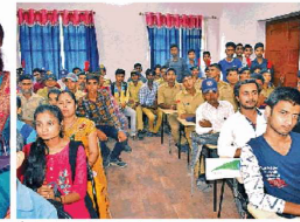
मौजूद छात्र-छात्राएँ।